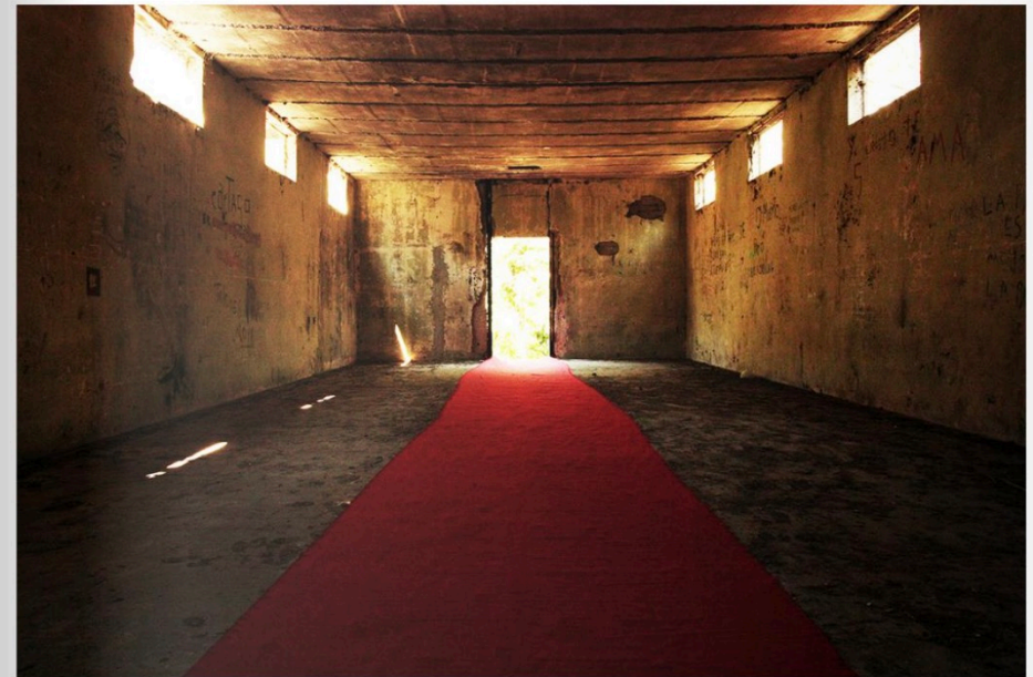
Camino de la memoria, Prisons du Costa Rica, Costa Rica, 2012

Myriam Lambert : Du plus loin que je me souviens, j'ai toujours été fascinée par la mémoire des lieux, leur architecture naturelle ou créée par l'homme, leur histoire, leur impact sur l'identité personnelle et collective des gens qui y vivent ou qui y ont vécu, les valeurs fondamentales qui y sont rattachées... Les éléments déclencheurs de chacune de mes œuvres sont les lieux (connaître leur identité ainsi que celles des gens qui les habitent), leurs contextes, leurs paroles, leurs mémoires, etc. Par