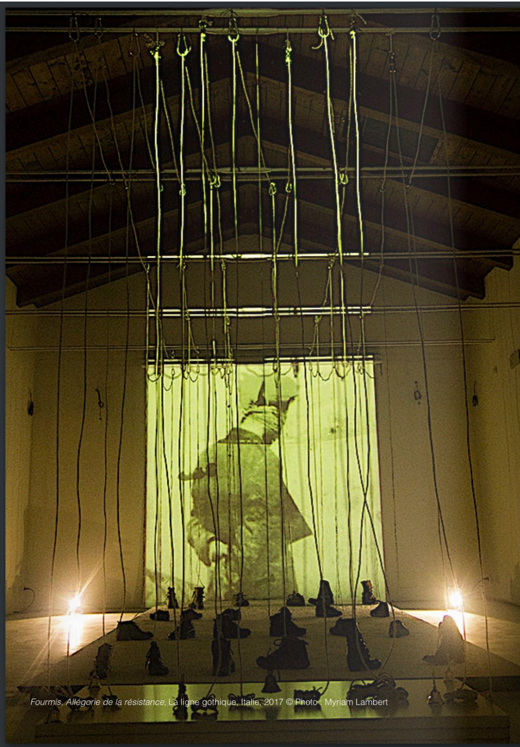
Fourmis, Allégorie de la résistance, La ligne gothique, Italie, 2017

Chroniques en mouvement : Myriam Lambert : révéler la mémoire des lieux