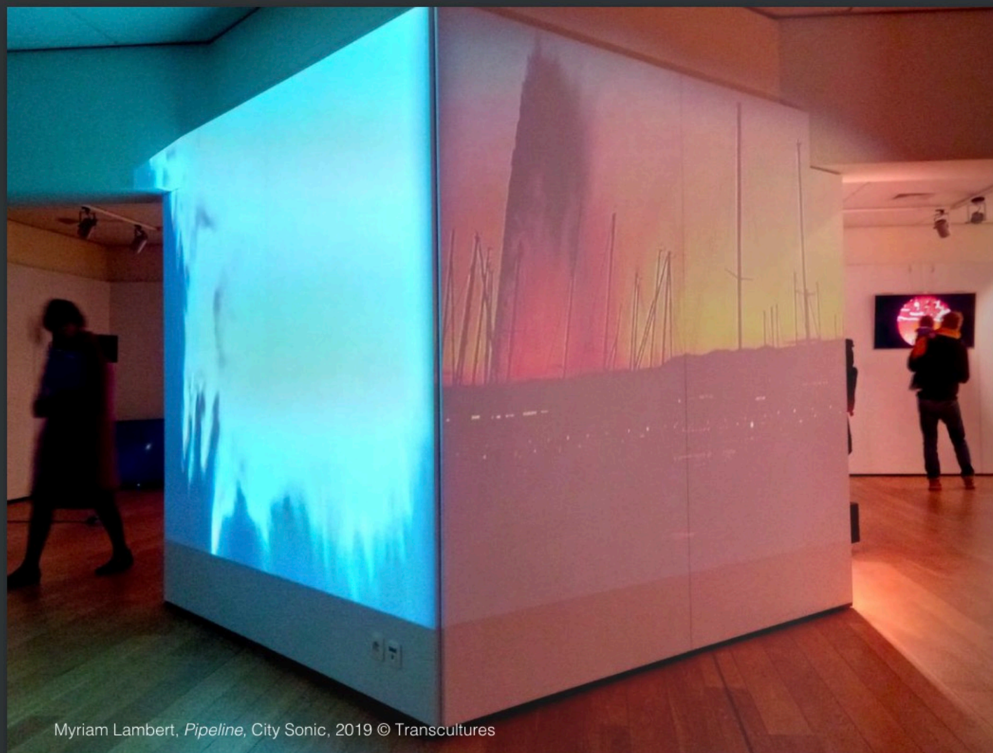
Myriam Lambert, Pipeline , City Sonic, 2019 © Transcultures

emblème m'a évoqué, lors de ma première impression de nuit, un puits de pétrole qui vient d'éclorre. Si les couleurs divergeaient, la forme, elle, était fort comparable. Par le biais de plusieurs tournages aux abords du Léman, ce jet est devenu pétrolier. Dans une perspective artiste (développée préalablement), cette œuvre est aussi une réaction face à la volonté du gouvernement libéral canadien d'implanter un oléoduc d'un océan à l'autre du pays. D'autre part, je suis native de l'Abitibi-Témiscamigue, une région que j'affectionne tout particulièrement pour ses magnifiques forêts, ses centaines de lacs d'eau potable et sa nature abondantes. Les industries minières et forestières qui s'y sont implantées, ont dé/construits une bonne partie de ces paysages qui font aussi partie, dans leurs mutations/défigurations, de nos identités col-