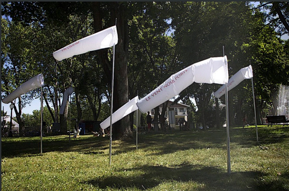
Culture de bourrasques, Bas-Saint-Laurent, Québec, 2018

public est exposé aux enjeux auxquels différents espaces font face à cause de la fonte des glaces, la submersion du territoire.