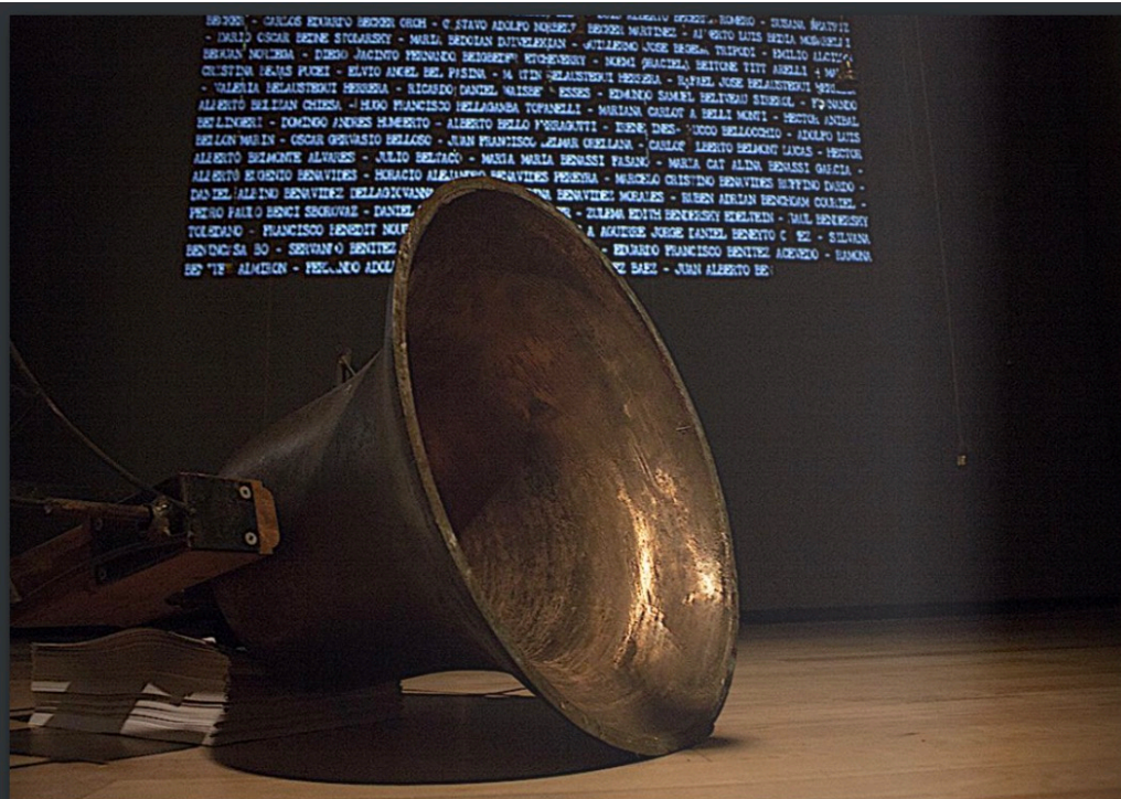
Myriam Lambert, Chemin des disparus II (version installation), Manif d'Art 7, Québec, 2014

lective canadienne est venue s'intégrer à d'autres enjeux par des textes, des vidéos d'archives, des contextualisations ou par le sujet même. Mon livre Chemin des disparus (paru en 2014 aux éditions J'ai vu) respecte également cette approche. Au travers de la mémoire collective racontée par les sud-américains, les enfants des disparus de la dernière dictature, des anciens disparus, etc. j'y suggère une distanciation/identification. En effet, en mettant ces textes d'Argentins en confrontation avec des images d'anciens camps d'internement canadiens et mes réflexions écrites lors de mes errances d'un ex-camp de concentration argentin à l'autre, j'amène le lecteur à réaliser que les camps ne sont pas si loin de nous, qu'il y en avait aussi, chez-nous... un fait inconnu pour la grande majorité des Canadiens.